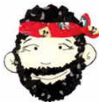
ひげおやじの「え・もじ」