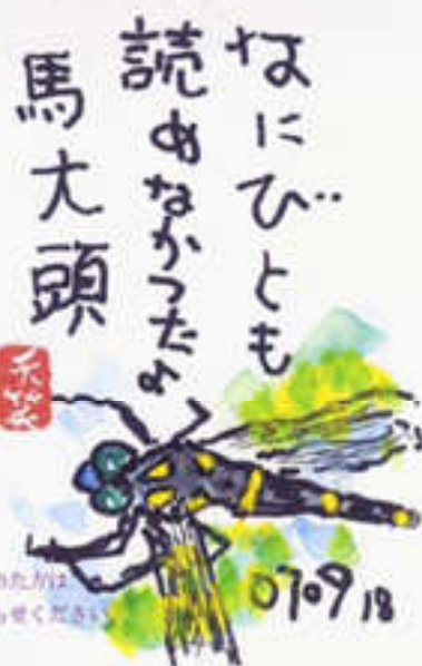
「馬大頭」は「オニヤンマ」と読みます